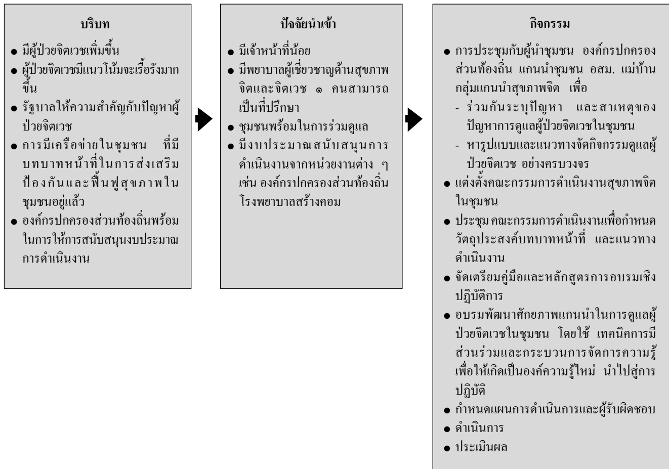
แผนภูมิที่ 2 บริบท ปัจจัยนำเข้าและกิจกรรมในการพัฒนาระบบการดูแลผู้ป่วยจิตเวชในชุมชน โรงพยาบาลสร้างคอม จังหวัดอุดรธานี