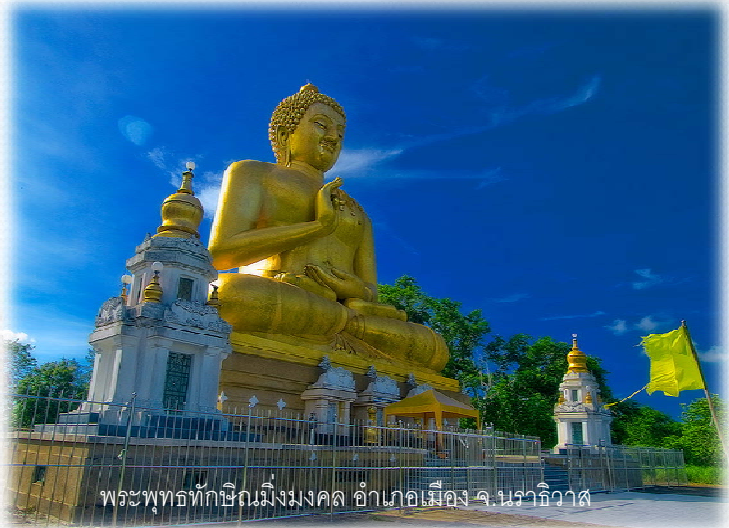
พระพุทธทักษิณมิ่งมงคล อำเภอเมือง จ.นราธิวาส