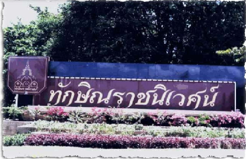
ทักษิณราชนิเวศน์