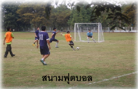
สนามฟุตบอล