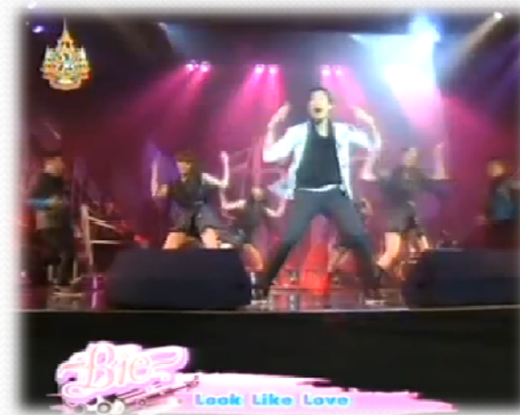
Ruteen to concert