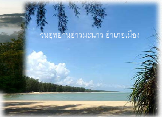
วนอุทยานอ่าวมะนาว อำเภอเมือง