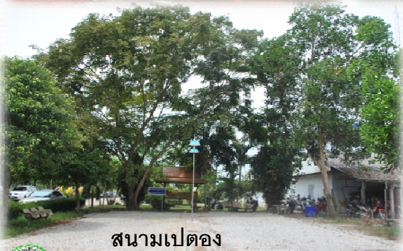
สนามเปตอง