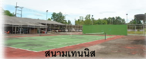
สนามเทนนิส