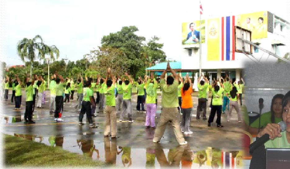
กิจกรรมออกกำลังกายเต้นแอโรบิค