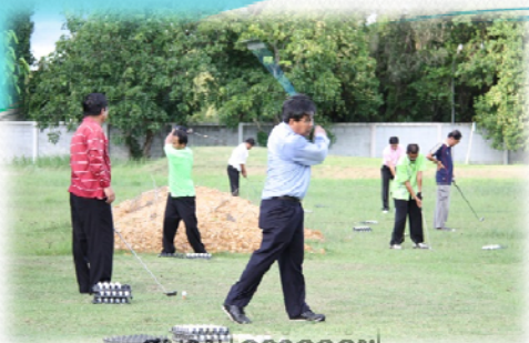
สนามเดร์วกอล์ฟ