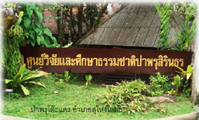
ป่าพรุโต๊ะแดง อำเภอสูโงโกด