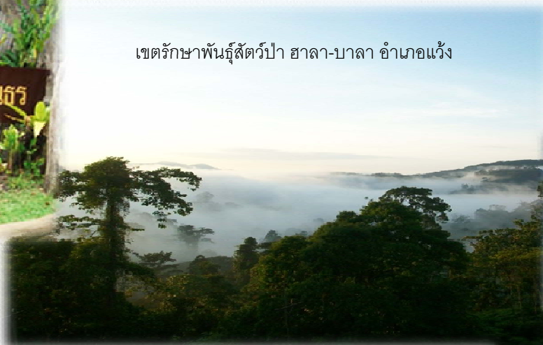
เขตรักษาพันธุ์สัตว์ป่า ฮาลา-บาลา อำเภอแว้ง