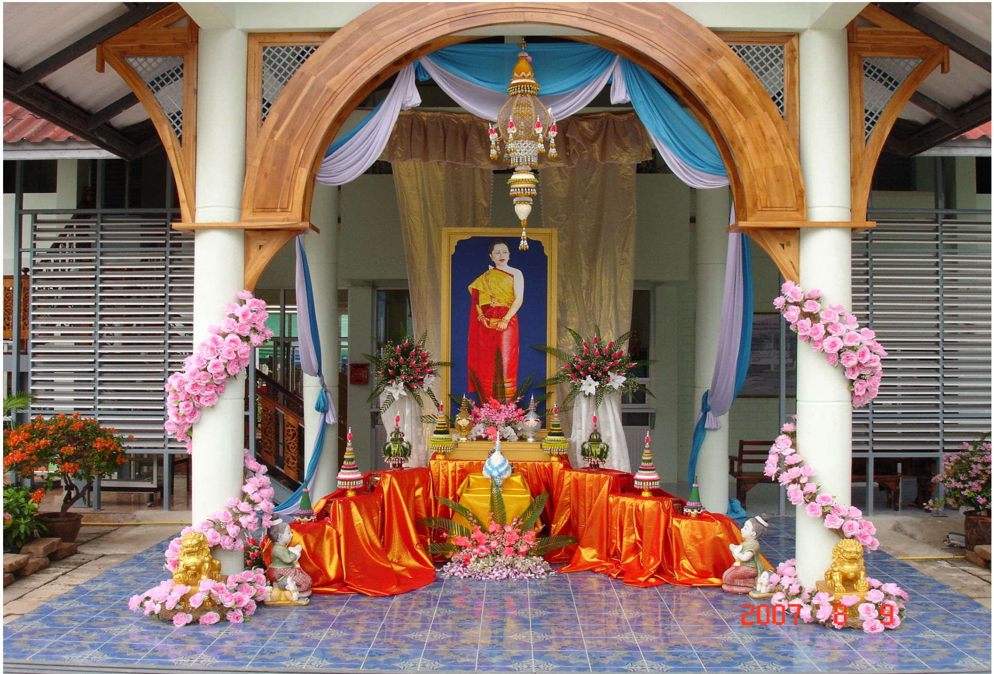
สอ.น.ลำพญากลาง จ.สระบุรี