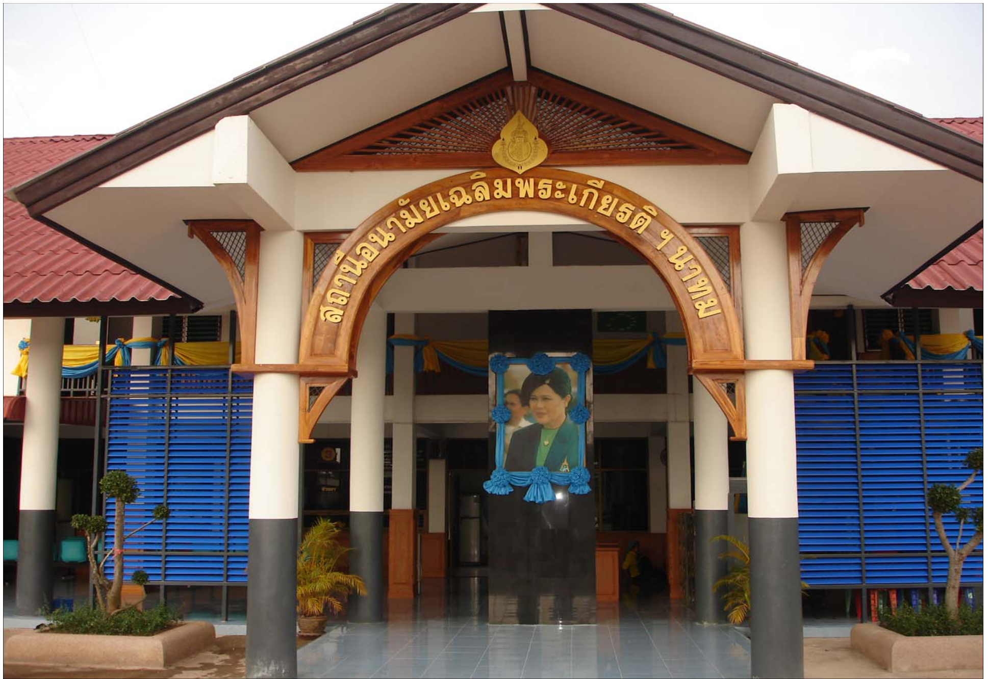
สถ.น.นาทม จ.นครพนม