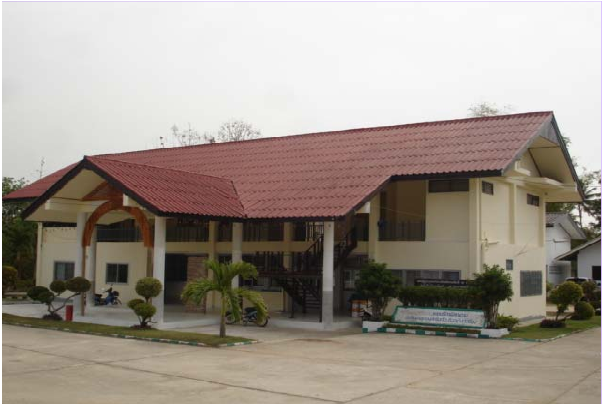
สอ.น.หนองใหญ่ จ.บุรีรัมย์