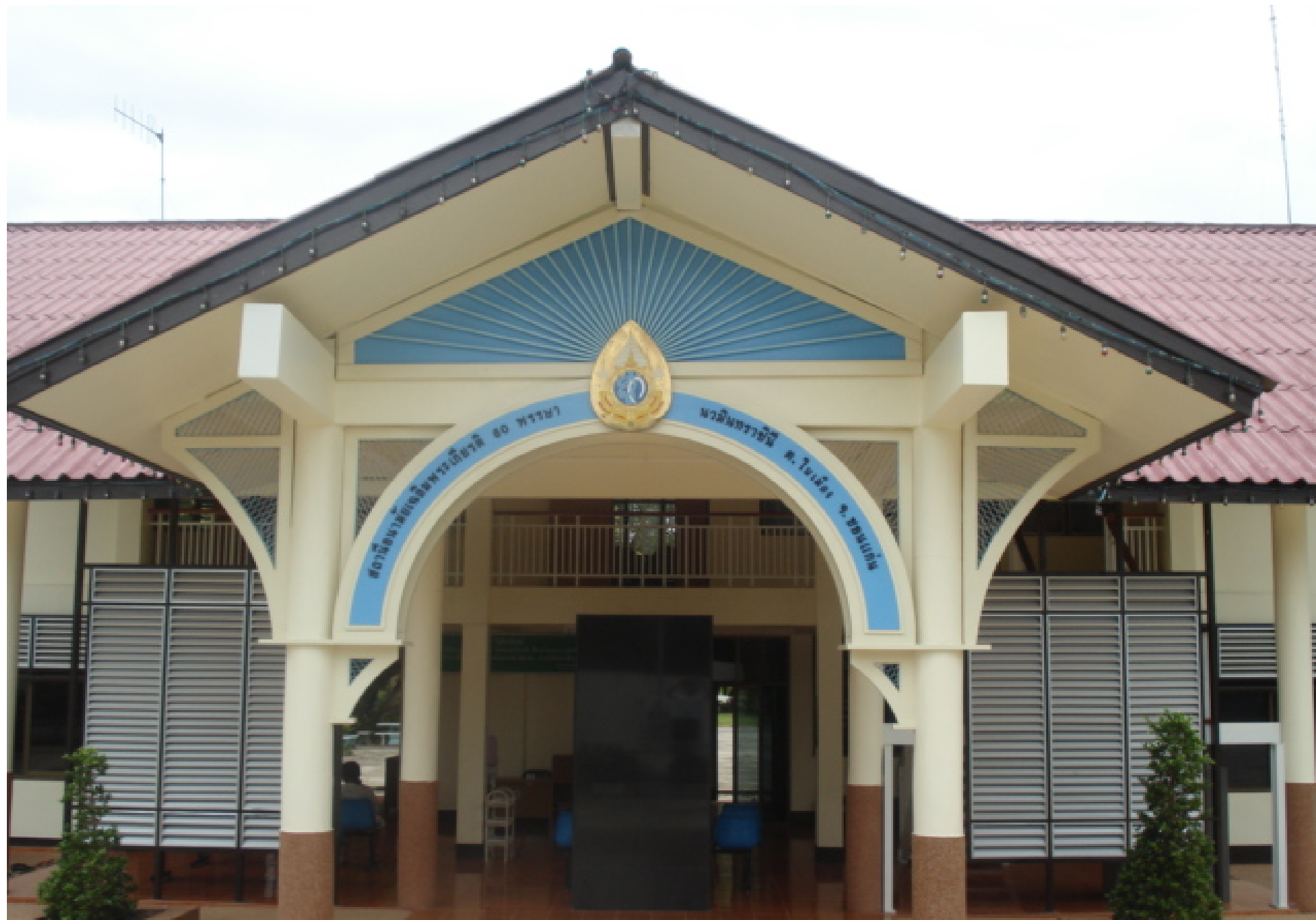
สอ.น.ในเมือง จ.ขอนแก่น