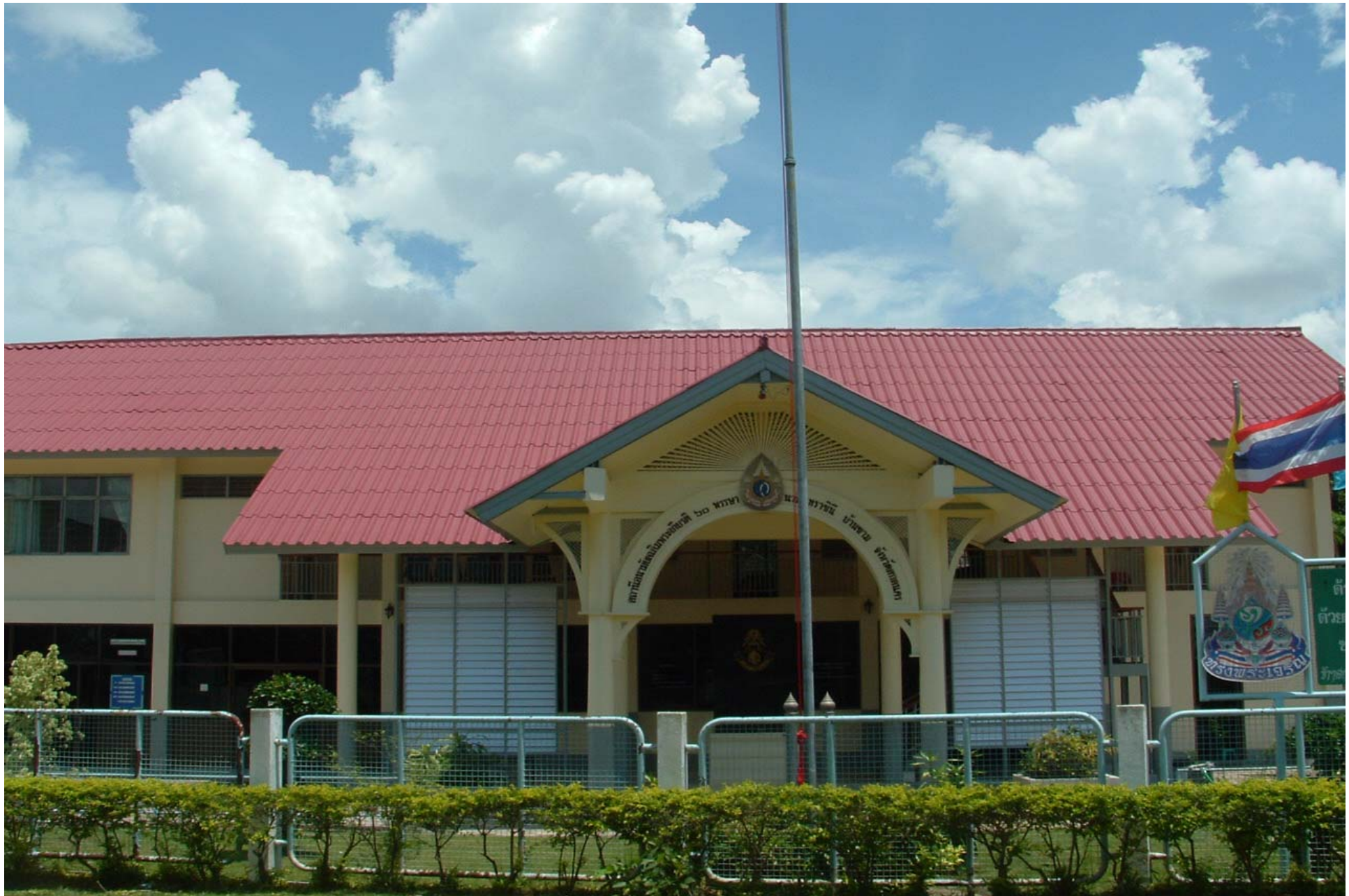
สอ.น.บ้านขาม จ.สกลนคร