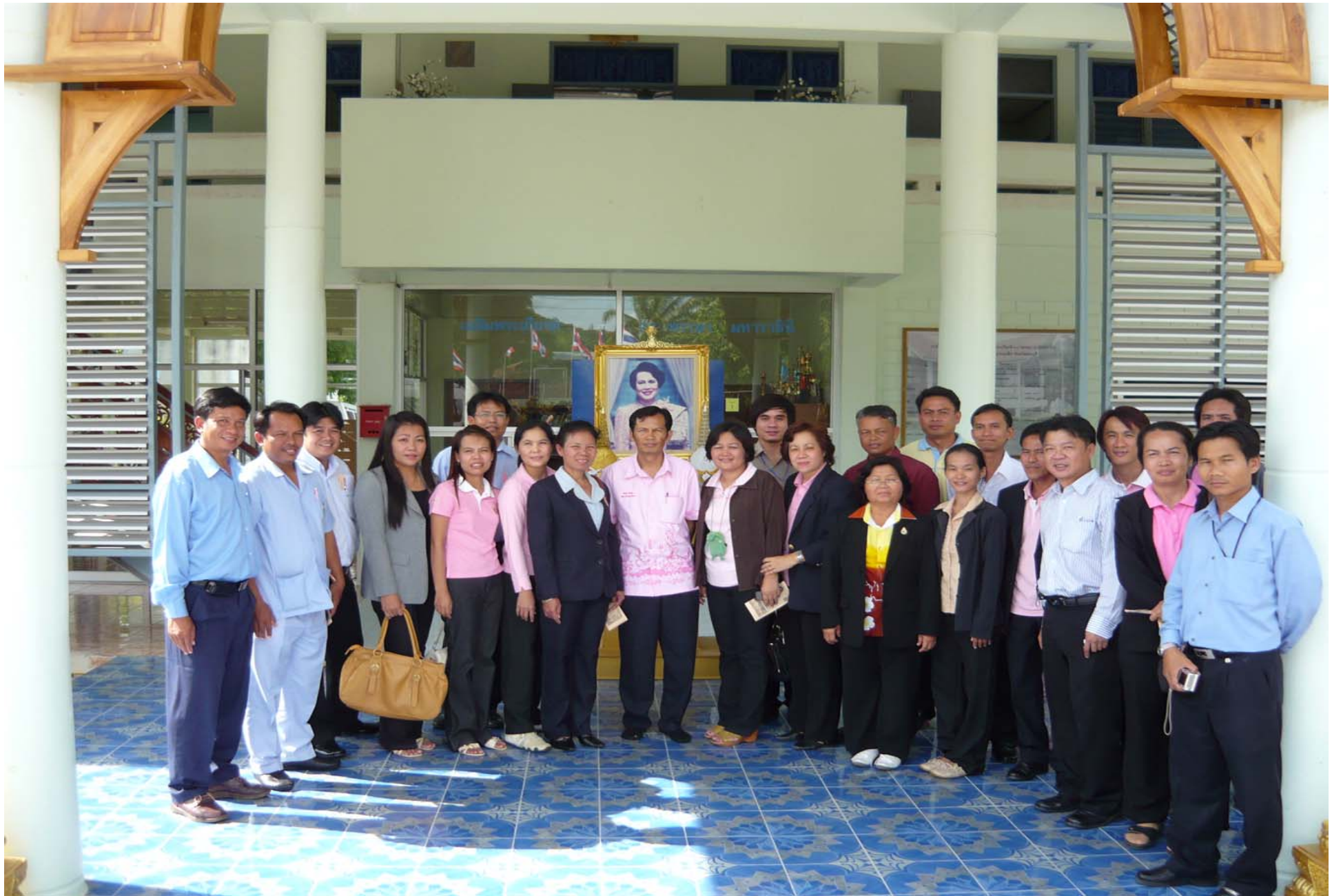
สอ.น.ลำพูนกลาง อ.มวกเหล็ก จ.สระบุรี