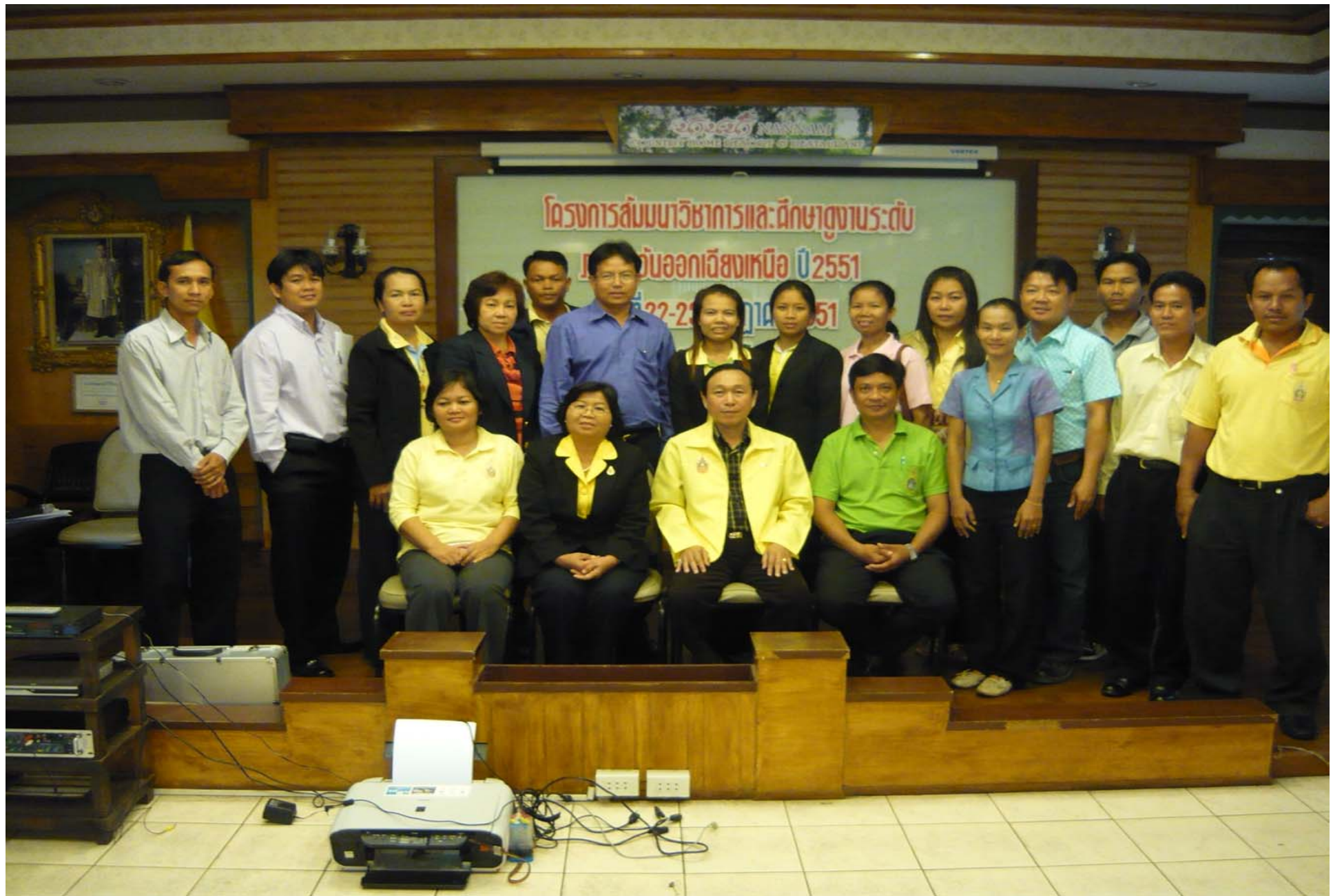
สัมมนาวิชาการภาคอีสาน อ.ปากช่อง จ.นครราชสีมา วันที่ 22-23 ก.ค.51