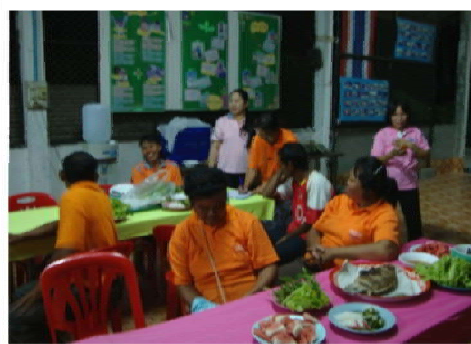
ร่วมรับประทานอาหาร