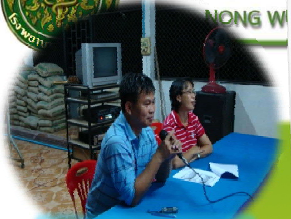
ชี้แจงการสนทนา