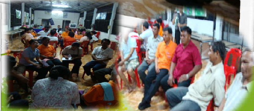
ฟังอย่างลึกซึ้ง