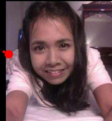
ต.วังใหม่