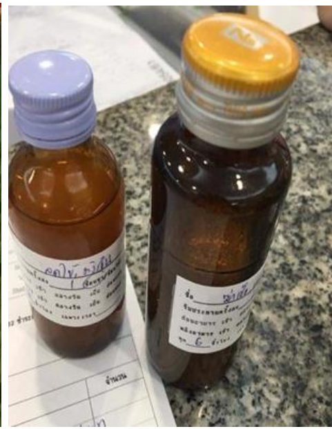
Yachud No labelled medicines