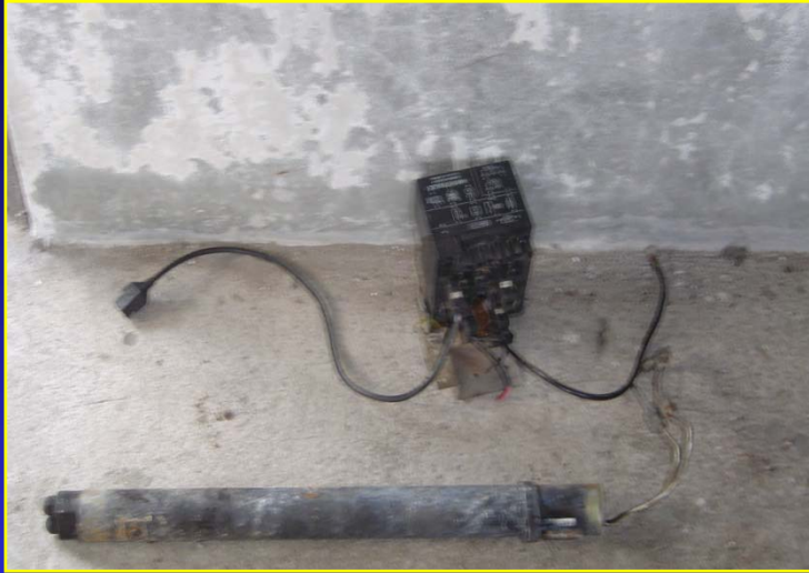
➔ หัวเผาระบบน้ำมันเชื้อเพลิง