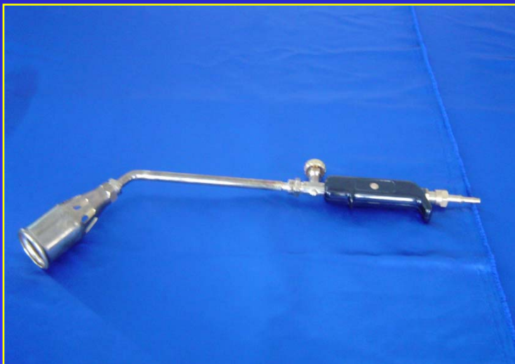
➔ หัวเผาระบบแก๊ส