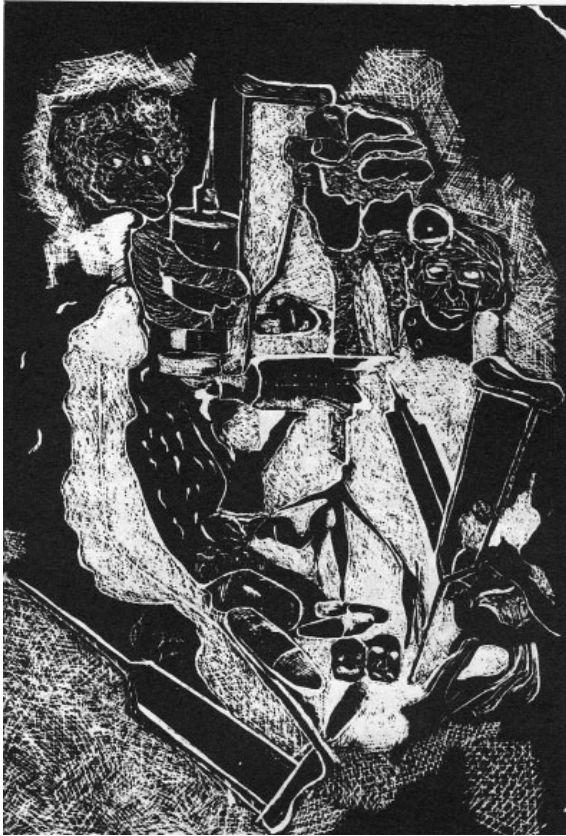
รูปที่ ๑ ภาพชุดบนแผ่นไม้

เธอชื่นชอบ. ในรูปที่ ๒ เธอวาดระบายรูปดาวบนใบเรือให้เป็นสัญลักษณ์ของผู้หญิงคนหนึ่งที่เคยดูแล สั่งสอนและแนะนำ เธอเสมือนบุตรของตัวเอง, แสดงเจตคติของแม่ที่ดีซึ่งเธอสามารถแยกแยะนำมาใส่ใจกับการถนอมรักษาตัวเอง และให้ความสนุกสนานแก่ชีวิต.