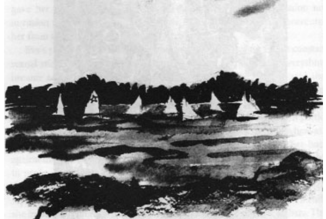
รูปที่ ๒ ภาพเรือใบ

เมื่อการรับจิตบำบัดของเธอใกล้จะสิ้นสุดลง ฮิวาขอให้ทางภาคบำบัดผลิตรายการวีดิทัศน์ ซึ่งเธอหวังว่าอาจช่วยผู้อื่นใน 'การรวบรวมตั้งสติ' แม้ว่าอดีตของพวกเขาบาดเจ็บแล้วร้ายต่างจากของเธอ. เธอตั้งชื่อบนแผ่นวีดิทัศน์ว่า 'นัยสำคัญของเส้นวาดเขียนในชีวิตของฉัน' ซึ่งมีตัวเธอและภาพวาดเส้นของเธอจำนวนหนึ่งเป็นตัวประกอบ. ในบท ฮิวาพูดถึงนัยสำคัญของการวางตัวอยู่ท่ามกลางสิ่งที่จะนำพาไปสู่พัฒนาการเจริญเติบโตและการรวบรวมตั้งสติให้เป็นเสมือน 'ชิ้นเดียว' - เรื่องของจิตบำบัด.