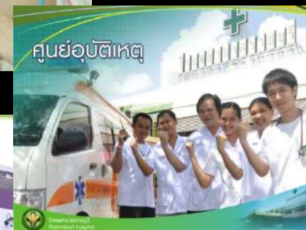
ศูนย์อุบัติเหตุ