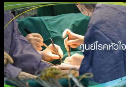
ศูนย์โรคหัวใจ