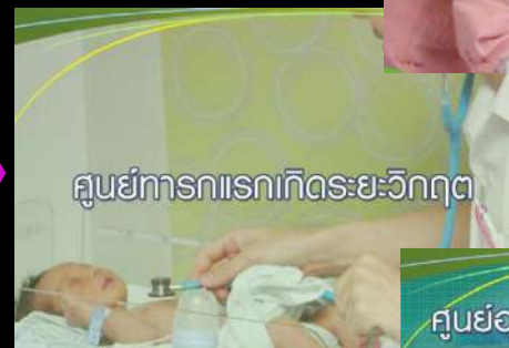
ศูนย์ทารกแรกเกิดระยะวิกฤต