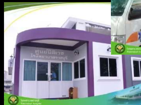
ศูนย์อุบัติเหตุ Trauma Center Rajabhat Hospital