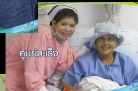
ศูนย์มะเร็ง