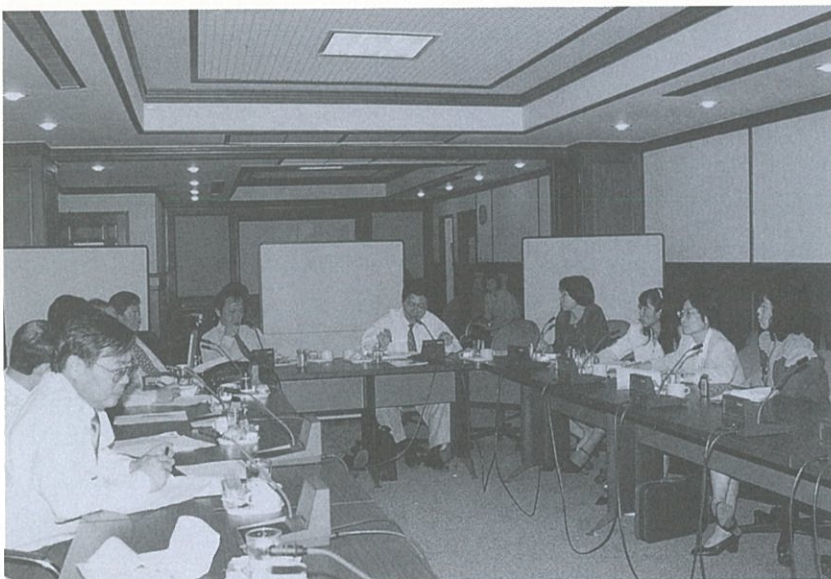
ผู้แทนหน่วยงานสาธารณสุขภาคีรัฐทั้งส่วนกลางและส่วนภูมิภาคประสานความคิดเห็นนักบริหาร นักกฎหมาย วางกรอบการวิจัยเพื่อปรับโฉมโรงพยาบาลภาครัฐเป็นอิสระ

2. มีวิธีการบริหารที่มีประสิทธิภาพ อ่านต่อหน้า 2