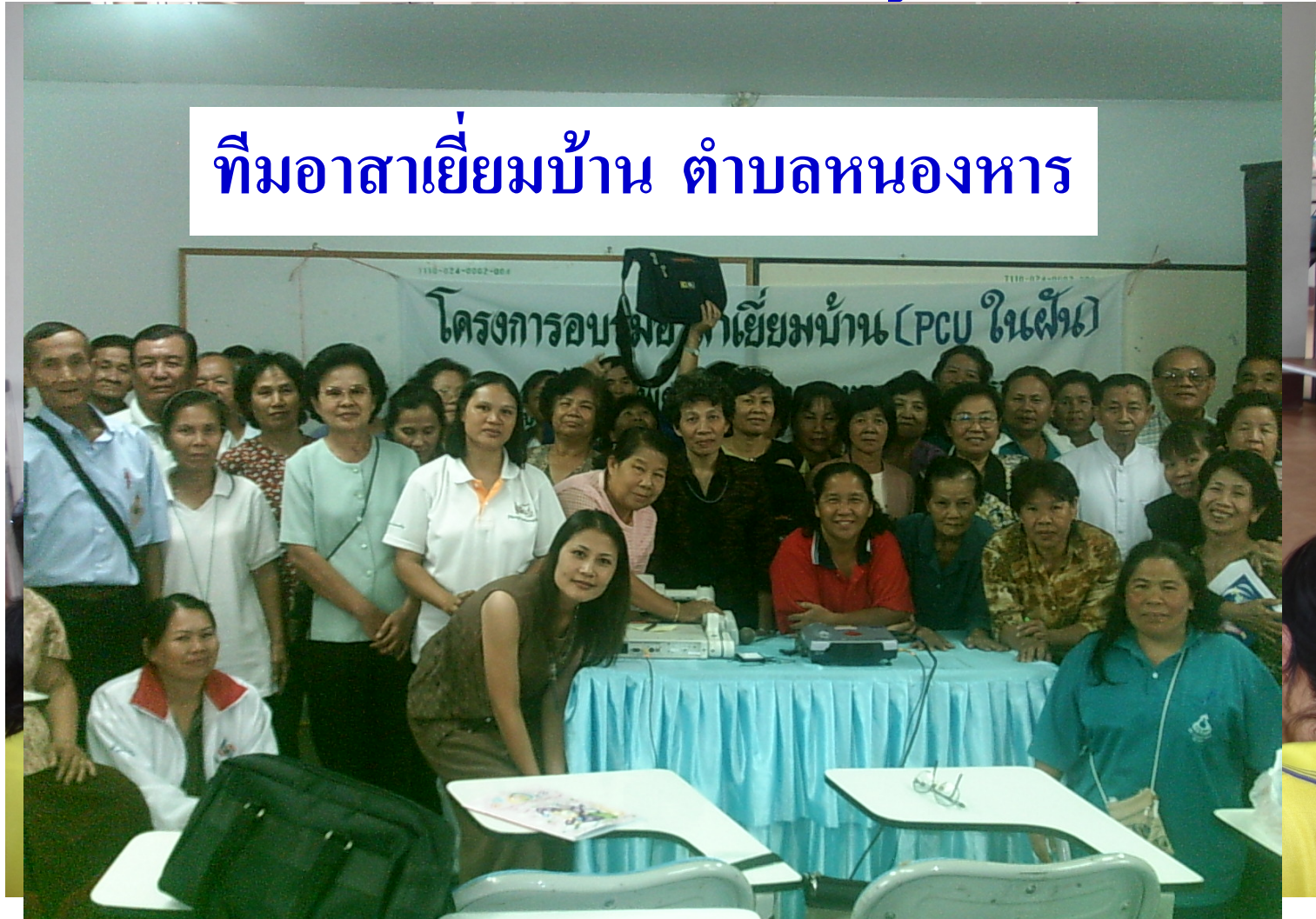
ทีมอาสาเยี่ยมบ้าน ตำบลหนองหาร