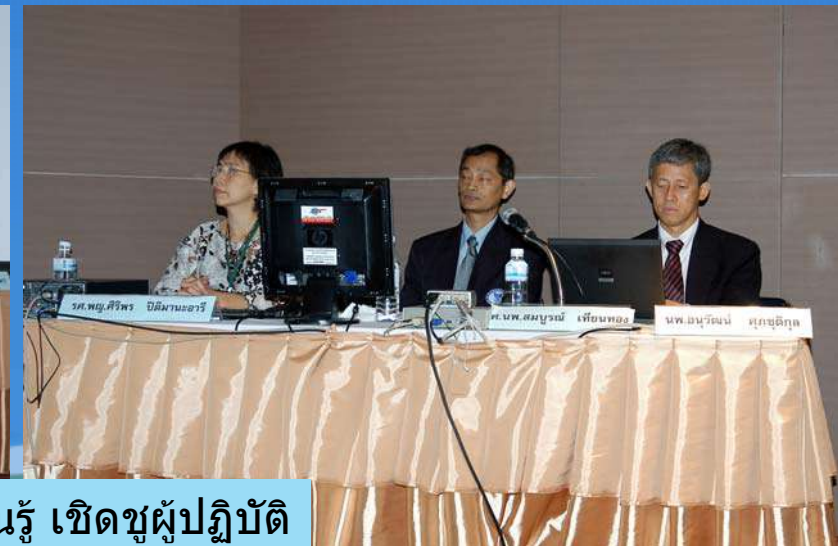
แลกเปลี่ยนเรียนรู้ เชิดชูผู้ปฏิบัติ