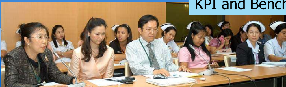
ทีมค่ายเบาหวาน จาก Best Implementation of the Year