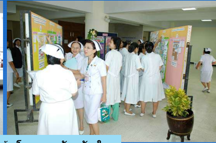
บอร์ดติดแผ่นกำลังใจ ร่วมลุ้นโหวตรางวัลขวัญใจฯ