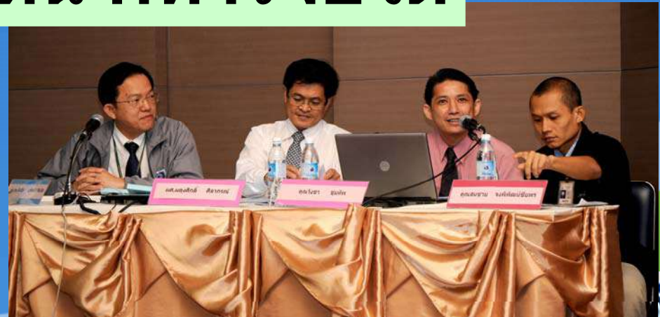
ทีมงานสถานเทคโนโลยีการศึกษาแพทยศาสตร์