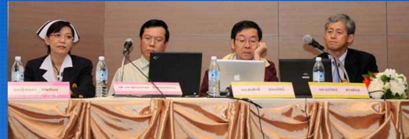
ทีมที่เป็นตัวอย่างในการใช้ Lean and Seamless