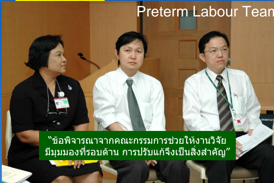
Preterm Labour Team

“ข้อพิจารณาจากคณะกรรมการช่วยให้งานวิจัยมีมุมมองที่รอบด้าน การปรับแก้จึงเป็นสิ่งสำคัญ”