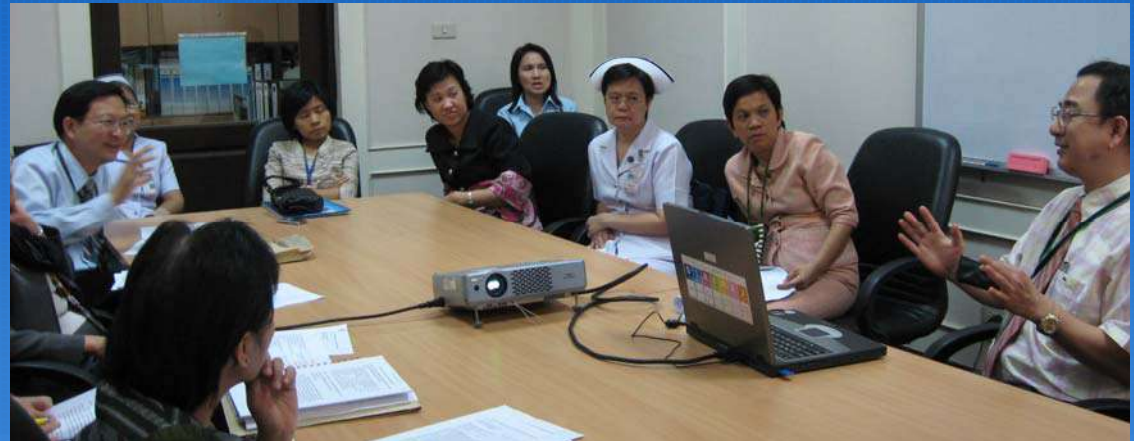
บรรยากาศการสัมภาษณ์