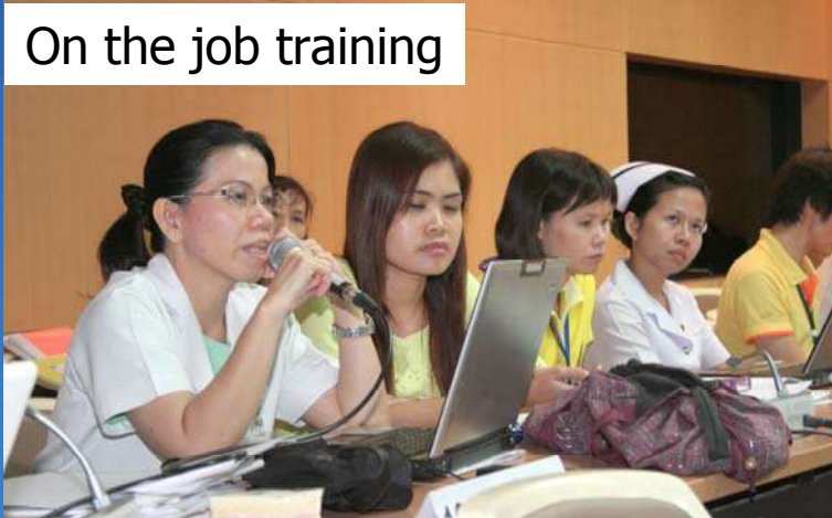
On the job training