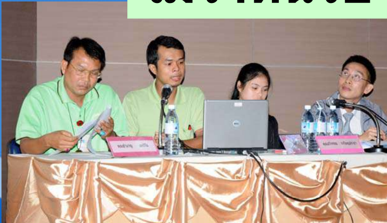
ทีมงานรักษาความปลอดภัย