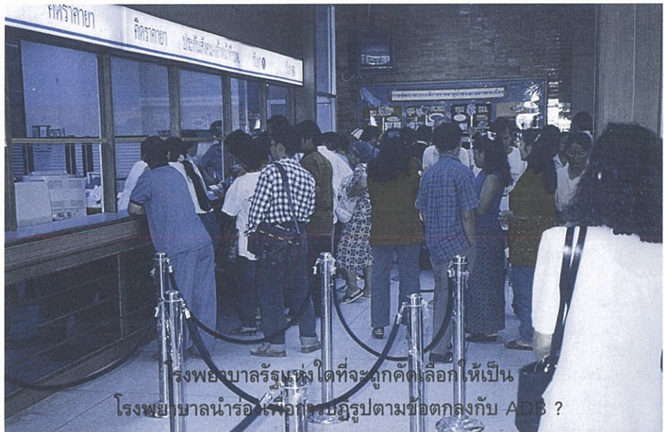
โรงพยาบาลรัฐแห่งใดที่จะถูกคัดเลือกให้เป็นโรงพยาบาลนำร่องเพื่อการปฏิรูปตามข้อตกลงกับ ADB ?