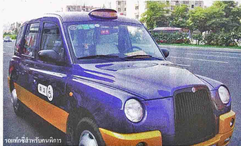
รถแท็กซี่สำหรับผู้พิการ

สำหรับทัศนคติของคนจีนที่มีต่อ "คนพิการ" อดีตนายตำรวจของจีนผู้นี้มองว่า "คนพิการก็เหมือนกับคนธรรมดาคนหนึ่ง แม้ว่าการทำงานระหว่างคนพิการกับคนปกติจะไม่