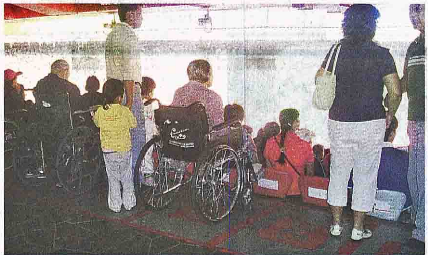
ที่เฉพาะไว้สำหรับผู้พิการเข้าชมกีฬา

และที่น่าตื่นตาตื่นใจ คือ "รถแท็กซี่สำหรับผู้พิการ" ที่เพิ่งมีขึ้นเพื่อรองรับการแข่งขันพาราลิมปิก 2008 ปีนี้เป็นการเฉพาะ