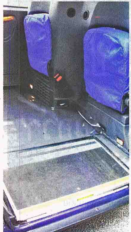
พ้อเปิดประตูจะมีทางลาดลงสำหรับรถเข็น